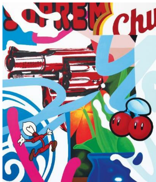
Speedy Graphito Suprem, 2017