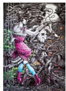
Jeune fille et la mort, Erdeven Djess