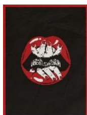
Mounia Youssef, Libérez l'expression, 2021