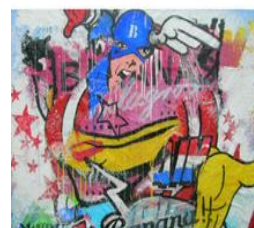
FenX, You must be my Lucky, 2020