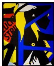
You must be lucky 2020